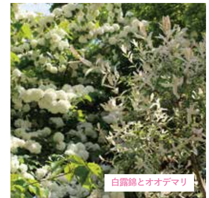
白露鐘とオオデマリ あたたかくなり春の訪れと共に芽吹き、春を代表する花木。